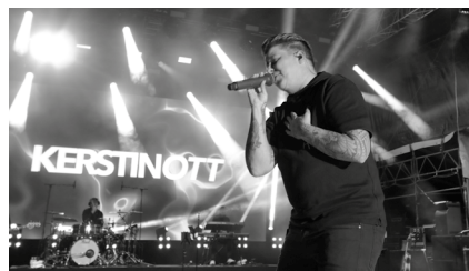
Links: Kerstin Ott genoss ihr erstes „Heimspiel“ sichtlich. Rechts: Graham Bonney feierte auf der Bühne seinen 80. Geburtstag und erhielt von den Veranstaltern eine Torte. Unten: 7000 Fans lauschen Sarah Connor beim Sonnenuntergang

Ideale Wetterbedingungen und ein attraktives Line-up der Stars lockten am Wochenende eine fünfstellende Zahl von Musikfans nach Büsum: 4000 Fans feierten am Freitag die Schlagerparty am Meer , deren Höhepunkt der erste Auftritt von Kerstin Ott vor heimischem Publikum war. Ausverkauft war das Legends at the Sea -Konzert von Sarah Connor: hier waren es 7000 Zuschauer, die diese besondere Kombination aus Welthits und der Abendstimmung am Meer feierten.