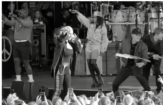
Sarah Connor begeisterte ihre Fans von der ersten Minute an

Ideale Wetterbedingungen und ein attraktives Line-up der Stars lockten am Wochenende eine fünfstellende Zahl von Musikfans nach Büsum: 4000 Fans feierten am Freitag die Schlagerparty am Meer , deren Höhepunkt der erste Auftritt von Kerstin Ott vor heimischem Publikum war. Ausverkauft war das Legends at the Sea -Konzert von Sarah Connor: hier waren es 7000 Zuschauer, die diese besondere Kombination aus Welthits und der Abendstimmung am Meer feierten.